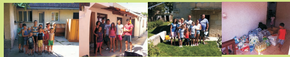
Obitelj Dugalić 10 djece

Ako poznajete bilo koga tko je uistinu potreban pomoci, javite nam!