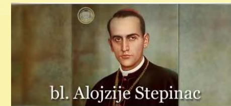
bl. Alojzije Stepinac

Rim je kolijevka zapadnog svijeta u kulturnom i vjerskom smislu. Osim posjeta